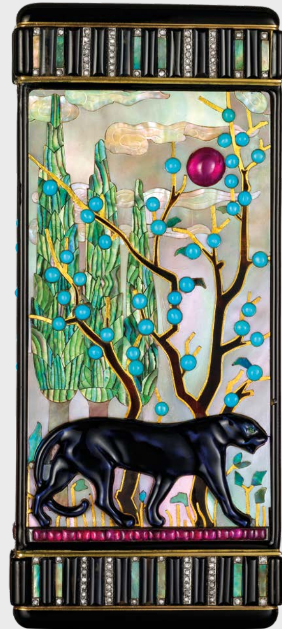
Schminketui »Panther« Cartier Paris, 1925