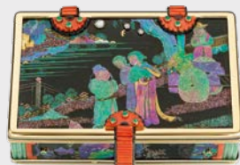
Lack-Etui Cartier Paris, um 1927

Ausstellung im Dialog Samstag, 5. Mai, bis Sonntag, 18. November, montags bis freitags 9 bis 17 Uhr und samstags nach Vereinbarung »Vom Rohstein zum Schmuckobjekt« Schütt – Schmuck & Edelsteine Goldschmiedeschulstraße 6, dem Reuchlinhaus gegenüber www.schuetz-schmuck-edelsteine.de Telefon 07231/22 00 1