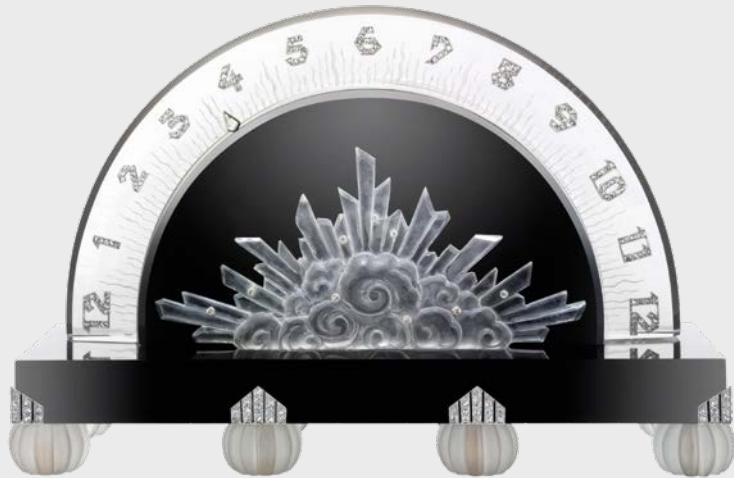
Retrogade Tischuhr »Wolke« Verger Frères Uhrwerk Vacheron Constantin Paris, 1927

One striking example is the »Panther« vanity case created by Cartier in 1925, displaying a panther against a backdrop of cypresses, the most prevalent trees in Persian miniature landscapes, and crafted from enamel, mother-of-pearl, rubies, turquoise, onyx and diamonds. The panther might have also been inspired by the drawings of Paul Jouve, who had illustrated Rudyard Kipling's Jungle Book. Compared to jewellery, vanity and other kinds of cases provided larger surfaces to accommodate reinterpretations of such exotic motifs. This masterpiece was showcased at the International Exhibition of Modern Decorative and Industrial Arts in Paris in 1925. In addition to cigarette and vanity cases, the Aga Khan Collection also comprises timepieces that incorporate masterfully crafted movements in exquisitely extravagant cases.