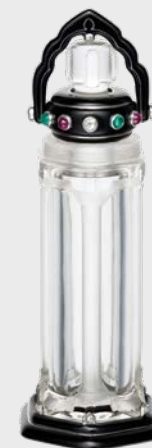
Parfumflakon Cartier Paris, um 1924

We would like to thank the lenders for their generosity.