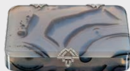
Achat-Etui Frankreich (?), um 1919