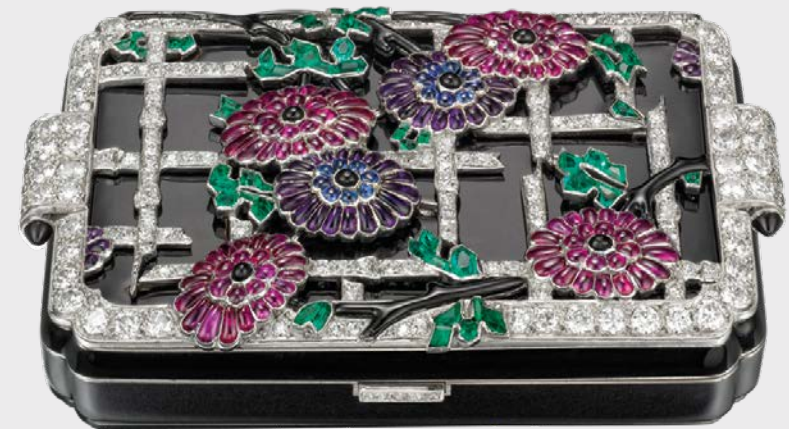
Schminketui »Chrysanthem« Lacloche Frères Ausführung Strauss, Allard & Meyer Paris, um 1928