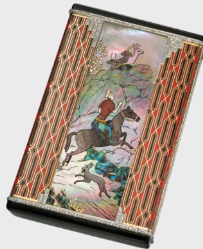
Schmink- und Zigarettenetui »Edelmann auf der Jagd« im Stil einer persischen Miniatur Van Cleef & Arpels Paris, 1930

In Gänze wurde die Sammlung erstmals 2017 im Cooper Hewitt Museum in New York gezeigt. Vor der Ausstellung in Pforzheim ist sie in der École des Arts Joailliers von Van Cleef & Arpels in Paris zu sehen, um anschließend im Musée des Arts Décoratifs in Paris präsentiert zu werden.